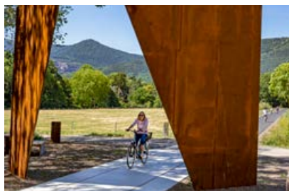
Les « Portes Bonheur »