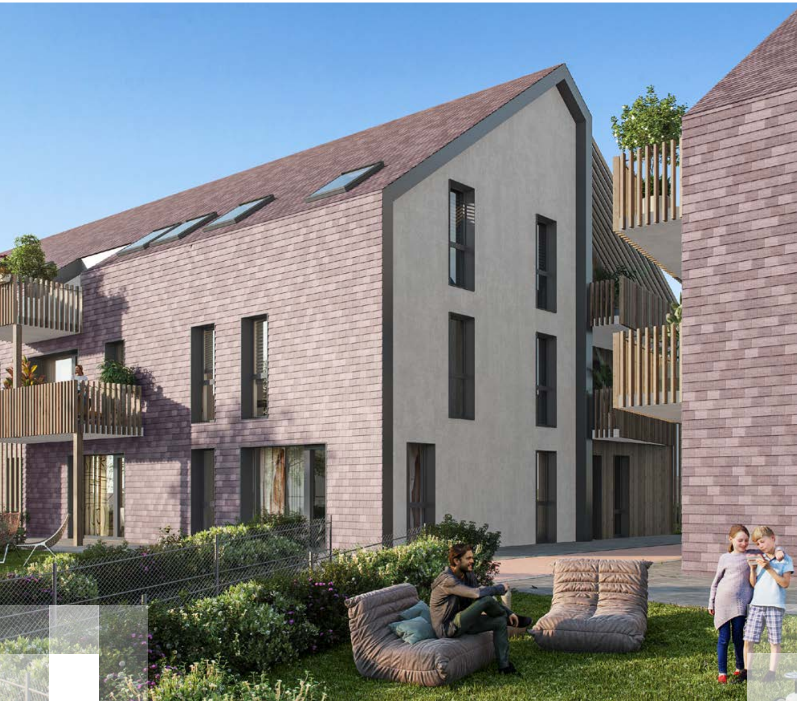
Vue depuis un jardin du « Clos Romane »