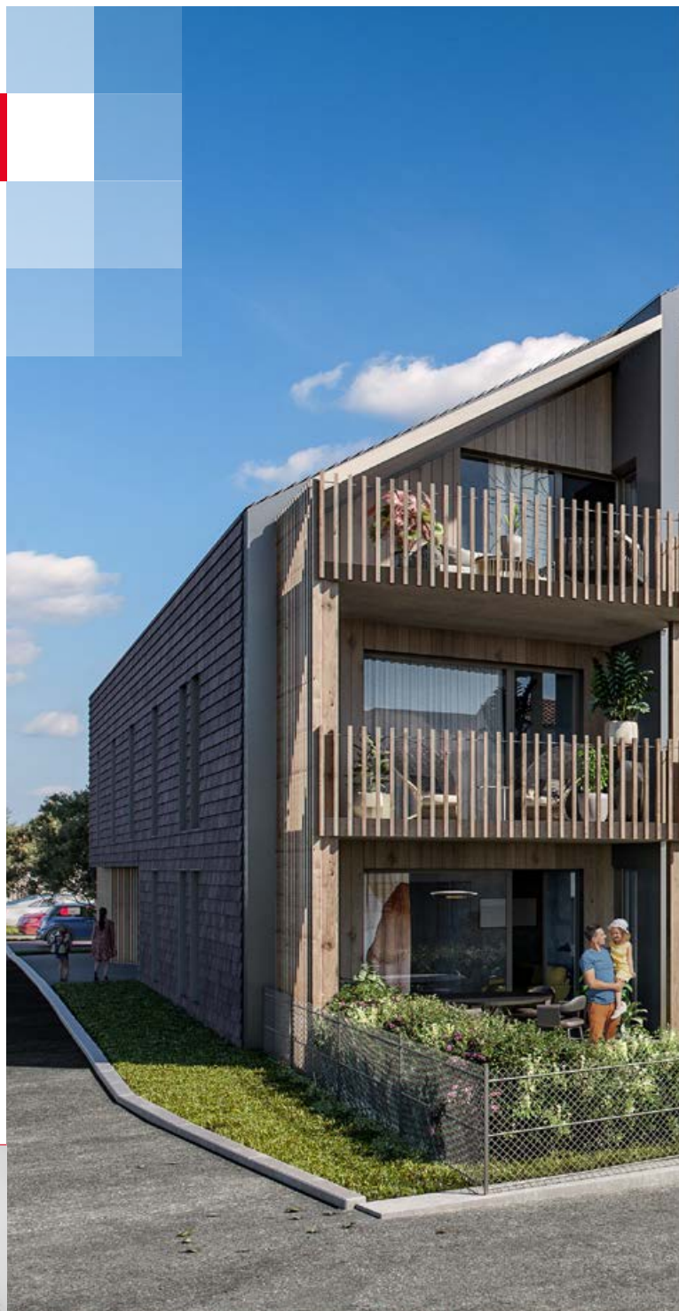
Vue depuis la rue Mittelweg