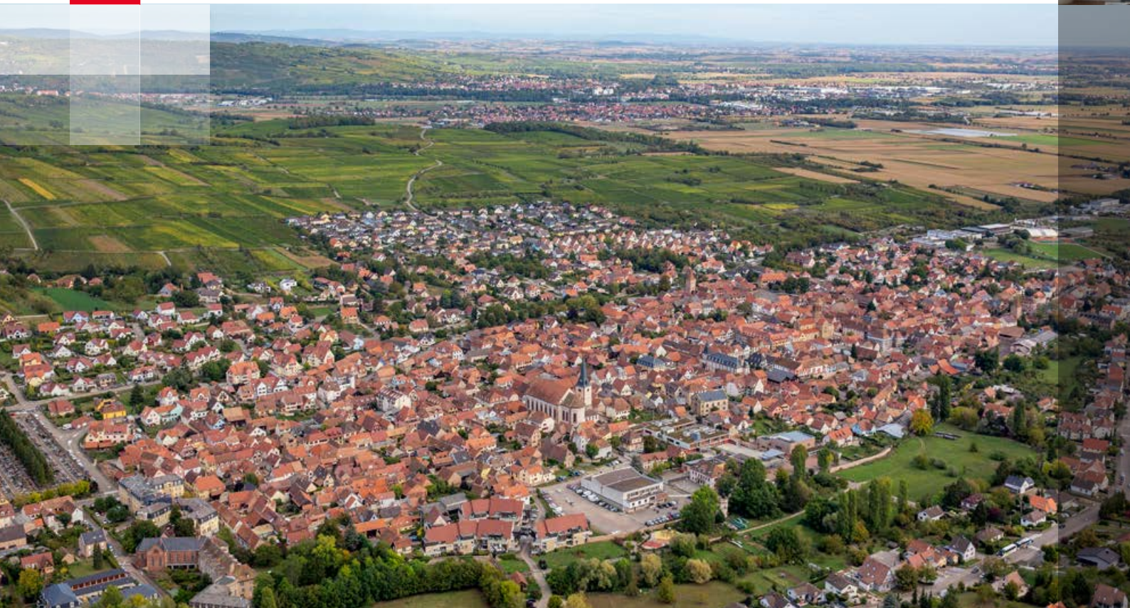
Rosheim vue du ciel