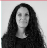
Émilie DEPIERRE LAMA ARCHITECTES

La végétation est omniprésente : les jardins sont arborés et privés entourés de haies, les locaux abritant les vélos présentent des toitures végétalisées. La voiture est stationnée sur un parking paysager en contre-bas, de part et d'autre d'espaces plantés. Les circulations douces sont nombreuses, elles sont autant de lieux de rencontres, pour petits et grands.