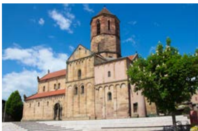
L'église romane datant du 8 ème siècle